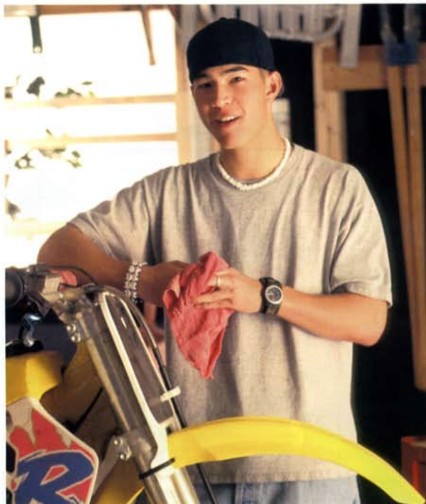
▲ Jongeren kunnen via het Adoptieproject op een geschikte plaats komen